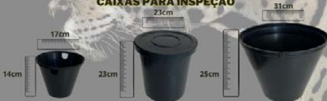
CAIXAS UTILIZADAS EM ATERRAMENTOS ELÉTRICOS